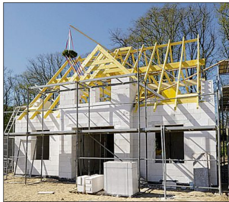
Beim Baustoff Porenbeton ist die Dämmung in Form von Millionen Luftporen gleich mit eingebaut.

Wofür manche Mauersteine häufig zusätzliche, in der Herstellung sehr energieintensive Dämmstoffe benötigen, das bewirken beim Porenbeton Millionen feinsten Luftporen: Bereits einschalige Wände erfüllen die Anforderungen von Energieeffizienzverordnung (EnEV) und KfW-Effizienzhäusern. Dafür winken von der staatlichen KfW-Förderbank zinsgünstige Kredite von bis zu 50 000 Euro pro Wohneinheit, die die Finanzierung erleichtern (www.kfw.de).