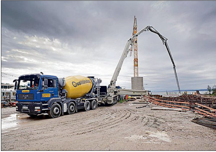
Wie normaler Beton lässt sich auch Ökobeton problemlos bis zur Baustelle transportieren.

An diesem „Grünen Beton“ arbeitet man aber auch noch anderswo. So stellten Wissenschaftler des Karlsruher Instituts für Technologie mit ihrem so genannten Celitement ein neues zementäres Bindemittel vor, das auf Calciumhydroxylsilikaten basiert. Das Bindemittel wird bei Temperaturen unter 300 Grad Celsius hergestellt – im Vergleich zu den etwa 1450