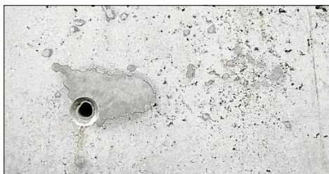
Sichtbetonflächen können heute jederzeit ausgebessert werden.

Dies richtet sich nach der Art der Bearbeitung, der Art der vorliegenden Verschmutzung sowie nach der Oberflächenfestigkeit der Betonfläche. Wenn das Vlies zu weich ist, verliert es nach kurzer Zeit seine Schleifwirkung und es werden nicht alle Verschmutzungen entfernt oder verbessert. Ist das Vlies hingegen zu hart, kann es zu sichtbaren Kratzern und Oberflächenabträgen kommen. Die Sicht-