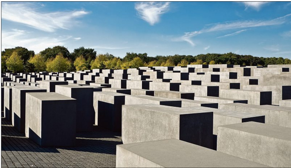
Auch die Sichtbeton-Stelen des Holocaust Denkmals in Berlin wurden kosmetisch nachgebessert.

Noch vor wenigen Jahren erklärte man eine ganze Reihe nicht seltener Abweichungen an Sichtbetonflächen für „nicht nachbesser-