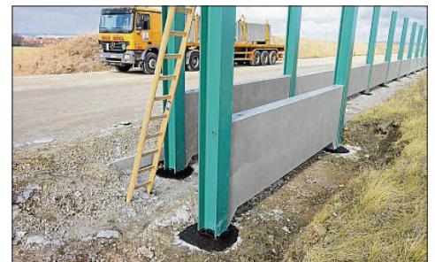
Einbau der Sockelelemente.

über die gesamte Länge konstant und wird in Abhängigkeit von den Pfosten, in denen sie gelagert werden, festgelegt. Zur Sicherstellung der Schalldämmung werden die Sockelelemente bis etwa fünf Zentimeter über die Unterkante mit einer wasserundurchlässigen Kies-schicht eingeschüttet. Die Höhe der Sockelelemente ist variabel und wird so festgelegt, dass am Einbauort die Oberkante des Sockel-