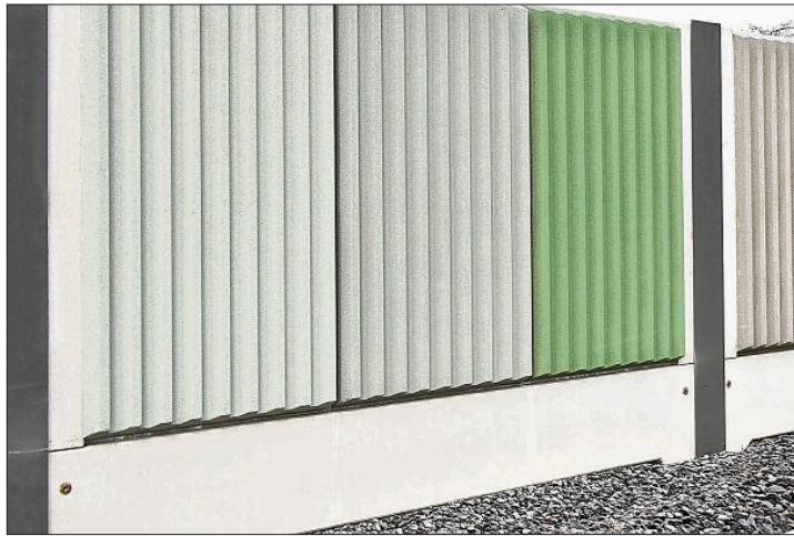
Eine fertiggestellte Lärmschutzwand.

Die LswB besteht im Wesentlichen aus vorgefertigten Wandelementen aus Beton, die in Stahlprofil-Pfosten gelemig gelagert werden. Die Gründung der LswB erfolgt durch im Boden eingespannte Ort betonpfähle. Länge und Durchmesser der Pfähle sind abhängig von den örtlichen Bodenbeschaffenheiten und den Kräften