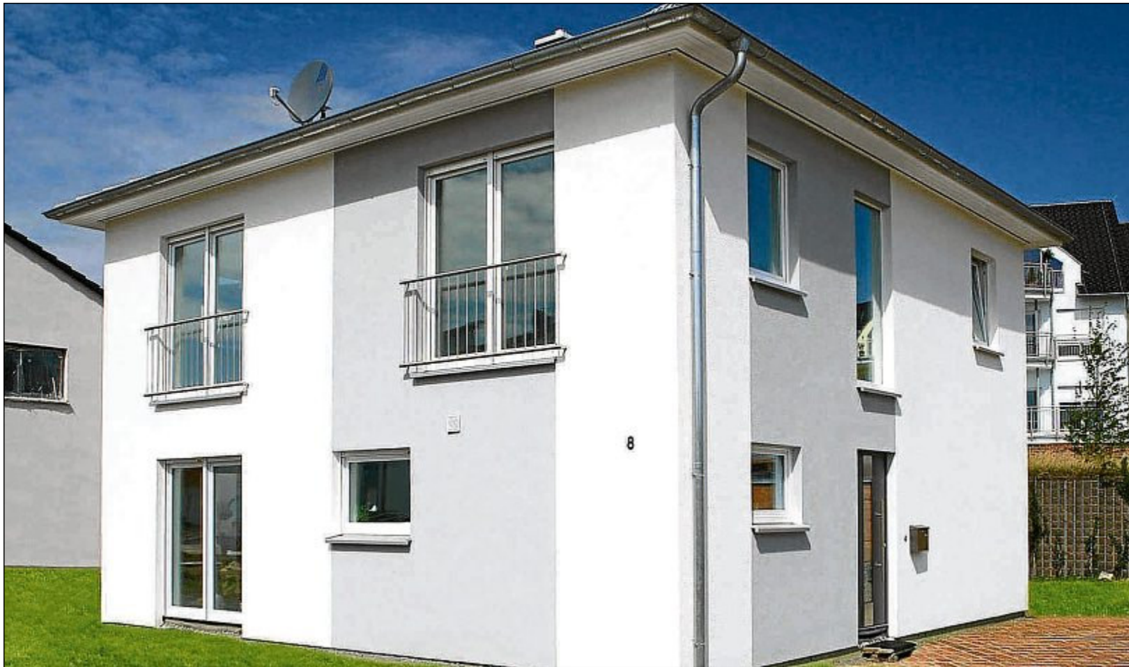
Kompakte Bauform, beste Wärmedämmung und Dreifach-Wärmedämmglas minimieren die Heizkosten.

So genannte Effizienzhäuser, besonders energieeffiziente Ge-