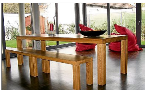
Die schlanke Gebäudehülle aus hochwärmedämmenden Mauerziegeln erreicht einen hohen Wärmeschutz – und das ohne aufwändige Zusatzdämmung der Außenwände. Vom Esstisch aus kann ungehindert in den Garten geblickt werden. Auf diese Weise entsteht eine perfekte Symbiose aus Wohnkultur und Natur.

ben der Berücksichtigung wirtschaftlicher Aspekte die Verwendung natürlicher beziehungsweise naturnaher Baustoffe aus der Region. Mit modernen Unipor-Mauerziegeln konnten die Vorgaben des Bauherren und die bauphysikalischen Anforderungen sowohl bei den Außen- als auch bei den Innenwänden erfüllt werden. Der für das Außenmauerwerk gewähl-