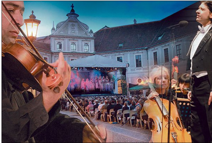
Der Brunnenhof der Residenz ist einer der markantesten Freilichtbühnen Münchens und ideale Kulisse unter anderem für Orffs Carmina Burana .

Bei Vivaldis Vier Jahreszeiten (7. August) und dem Galakonzert der Arena di Verona-Stars (12. August) erwartet das Publikum hochkarätige Klassik. Fans von Rock und Pop kommen bei der ABBA-Night (14. August) mit vielen Hits aus der Glanzzeit der Kultband voll auf ihre Kosten. Mit Carl Orffs Meisterwerk Carmina Burana (15. August) erwar-