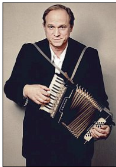
Dem Filmstar direkt in die Augen schauen: Ulrich Tukur hat sein Kommen für die Tage vom 26. bis 29. Juli angekündigt.

Diesjähriger Ehrengast ist der Schauspieler Ulrich Tukur ( Der Stellvertreter , Das Leben der Anderen , Das weiße Band ); seine