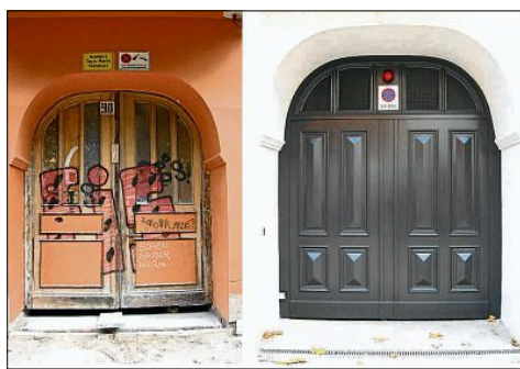
Mit emailliertem, schwarzem Sicherheitsglas belegt ist das Torblatt des Sammelgaragentors in Wels. Das Tor in Berlin vorher und nachher.