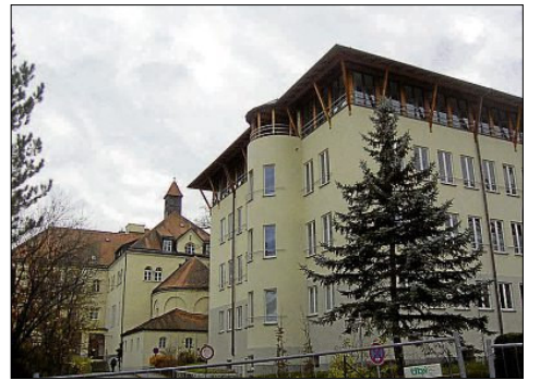
Das neue Verwaltungsgebäude der Artemed-Kliniken am Krankenhaus der Missionsbenediktinerinnen in Tutzing ist zwar nicht zertifiziert, aber als Skelettbau mit Innen- und Außenwänden aus Holz flexibel auf eine langjährige Nutzung ausgelegt.

Beurteilt wird nach den Kategorien nachhaltiger Grund und Boden, Wassereffizienz, Energie und Atmosphäre, Materialien und Ressourcen, Raumqualität sowie Innovations- und Designprozess. Um ein Zertifikat zu erhalten, ist die Einhaltung von mindestens