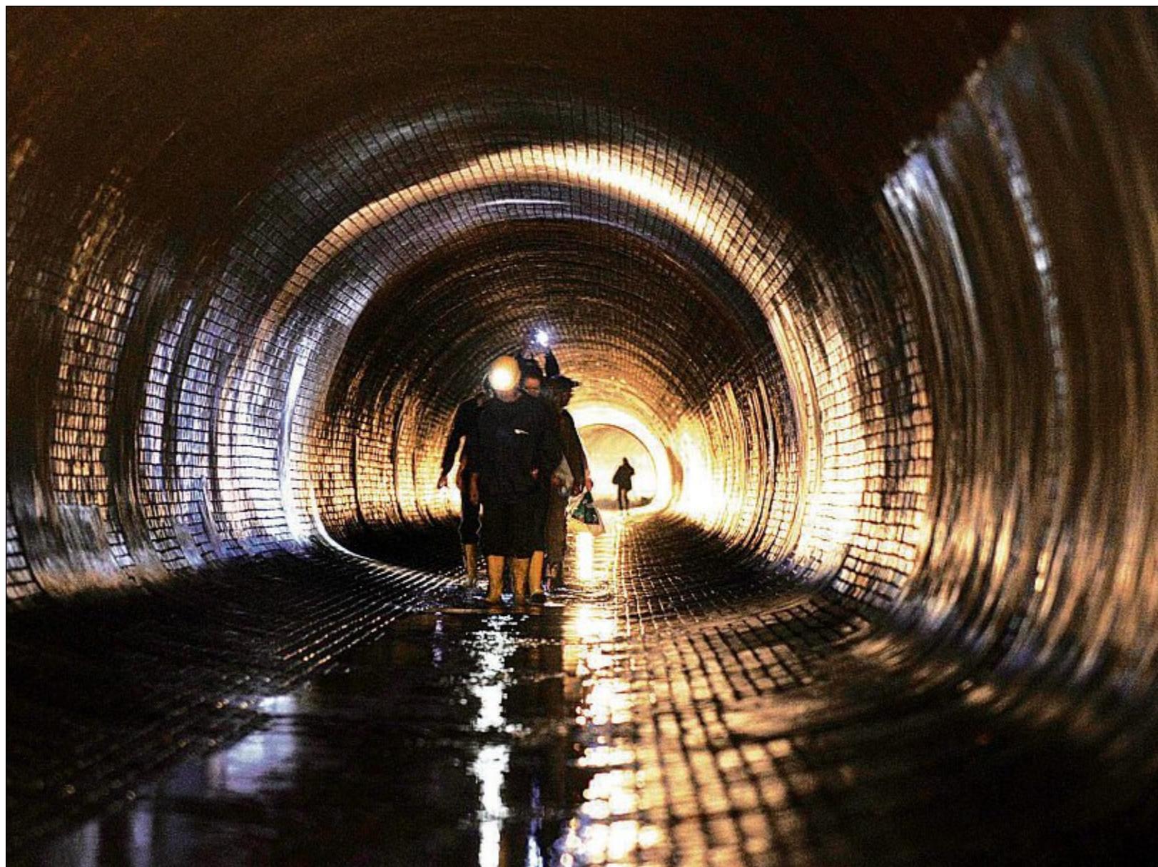
Im Geoinformationssystem gespeichert: Daten über das städtische Abwassersystem sind hilfreich bei der Planung von Neubauten.

Basis für jedes Geoinformationssystem ist eine computerisierte Verarbeitung der Datenbestände. Im Unterschied zu bisherigen elektronischen Datenverwaltung besteht das Grundraster der im GIS verarbeiteten Daten aus einer räumlich verorteten Matrix. Dazu gehört, dass das System unterschiedliche Datentypen annimmt und verarbeitet, also etwa Vektordaten zur geometrischen Modellierung, Rasterdaten, bei denen Fläche oder Volumen gleichmäßig unterteilt dargestellt werden, alphanumerische Daten aus Ziffern und Buchstaben und Multimediale Daten. GIS ist dabei ein querschnittsorientiertes Schlüsselsystem, das heute praktisch für alle komplexen technologischen und Planungsprozesse eingesetzt wird und dafür das entsprechend qualifizierte Personal benötigt. Auf Dauer kann sich keine Kommune